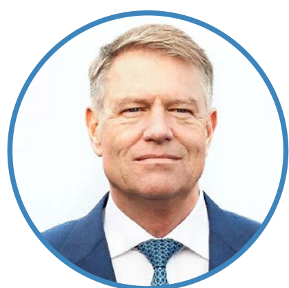
Klaus Werner IOHANNIS