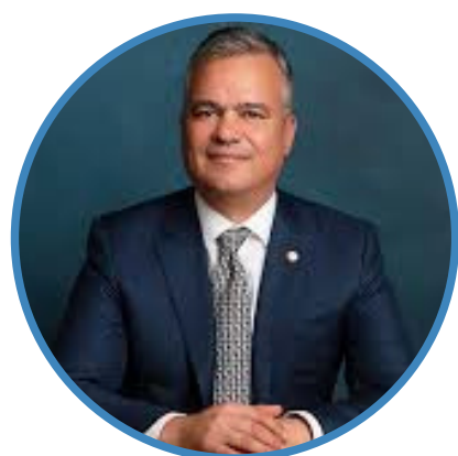
Adrian Ioan VEȘTEA

Ministrul Dezvoltării, Lucrărilor Publice și Administrației